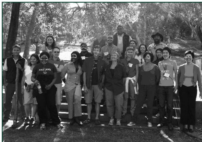
Partecipanti alla visita tecnica sull'esperienza Culturale Aborigena.

Persone di diverse nazioni e Paesi danzano insieme il "djitti djitti" con il viso dipinto; puoi immaginarlo? Grazie a IAIA08 per averci dato l'opportunità di sperimentare insieme la cultura aborigena.